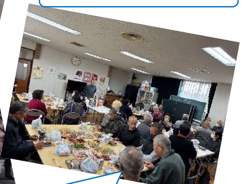
稲村区長の挨拶で新年会がスタートしました。