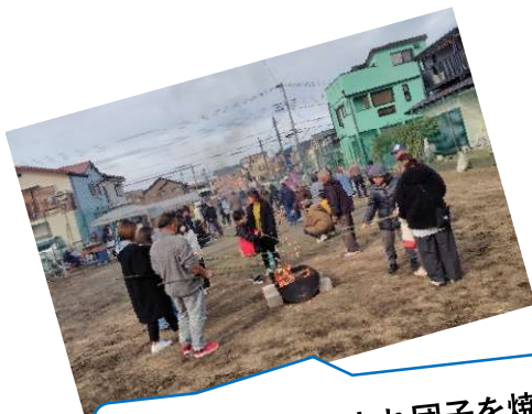
大勢の方が参加され団子を焼きました。