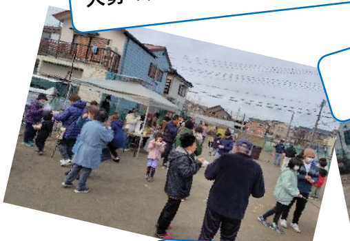
子供たちもおなか一杯になりました。