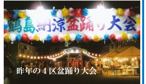
昨年の4区盆踊り大会