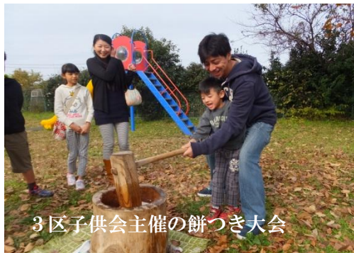
3区子供会主催の餅つき大会

ただやらされるだけの役員ではなく、自ら積極的に輪の中に入り楽しい自治会活動ができればいいなと思っています。